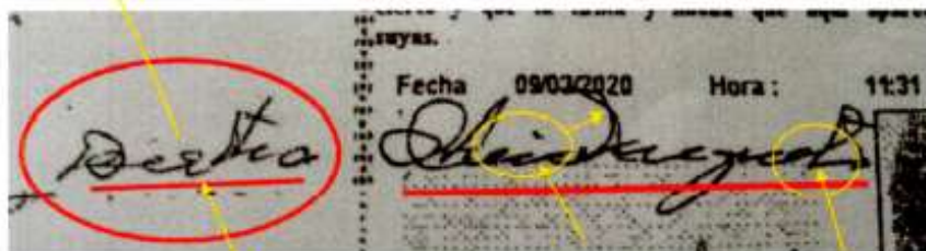
FIRMA FOTOCOPIA DENTRO DEL CONTEXTO NOTARIAL

La firma que está en el contexto del sello notarial presenta similitudes frente a la firma que se encuentra fuera del contexto notarial en cuanto elementos constitutivos del grafismo como lo indica el círculo y flecha amarilla, pero por tratarse de firma aportada y elaborada mediante reproducción fotostática (fotocopia) no es posible emitir una conclusión con certeza por lo tanto se hace necesario llegar a este laboratorio de Documentología y grafología forense el documento original .