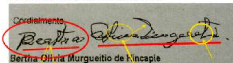
FIRMA FOTOCOPIA FUERA DEL CONTEXTO NOTARIAL