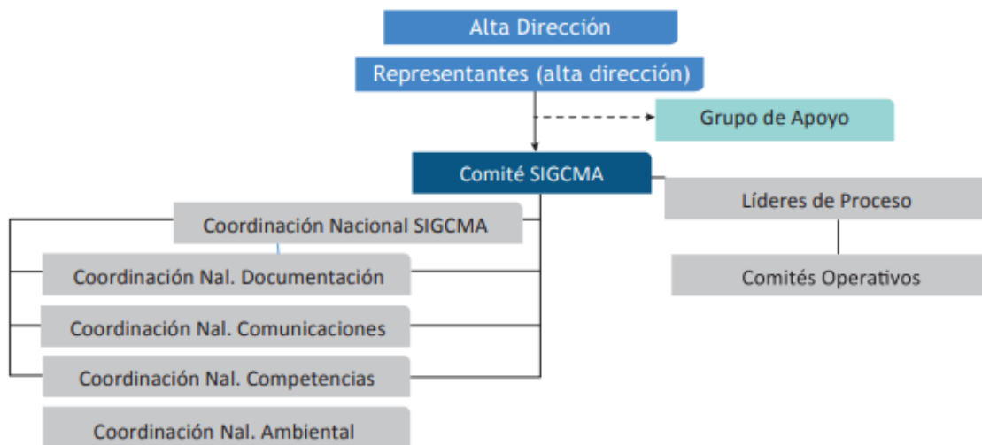
Diagrama No 1. Estructura de roles en el nivel central.

También se encuentra conformado el Comité de Calidad, del cual son miembros los Directores de las Unidades Misionales del Consejo Superior de la Judicatura y de la Dirección Ejecutiva de Administración Judicial, con el acompañamiento del Coordinador Nacional de Calidad y Medio Ambiente. Este Comité tiene a su cargo el desarrollo de las estrategias dadas por el Consejo en materia de sistemas de gestión y la formulación de propuestas y estrategias a la Alta Dirección para el direccionamiento del SIGCMA.